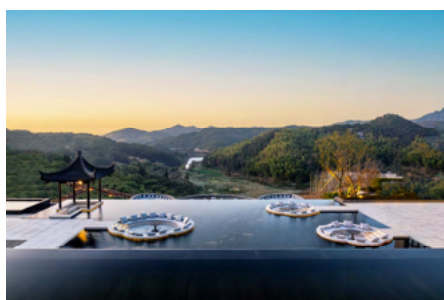
与群山相辉映的“养云池”