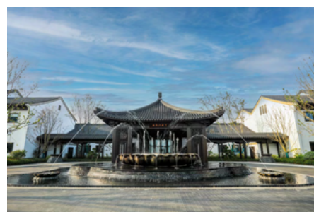
酒店入口处的“莲花喷水池”