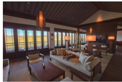
“山景嘉助套房”的客厅