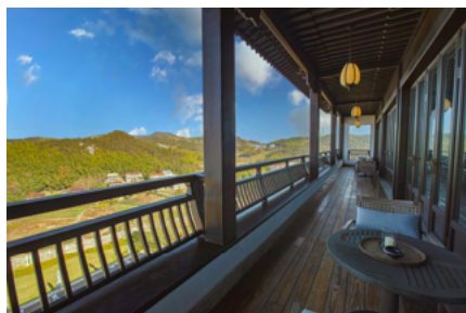
“山景房”的阳台展望

[*1]六根清净：佛教用语，谓眼、耳、鼻、舌、身、意六种感官，都可以看到、听到和得到一切愉快的感受，达到无烦无恼的境界。（源自《国语辞典》）