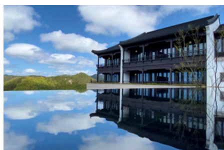
从大堂吧露台眺望山景