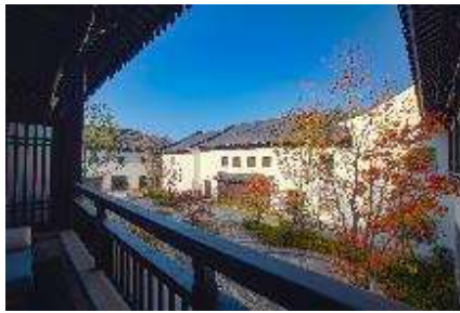
“庭院房”窗外的红叶