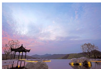
从酒店大堂远眺夕阳山景