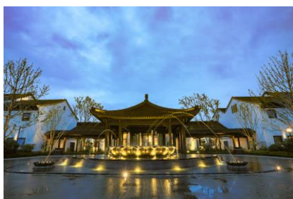
酒店入口的莲花喷水池

本酒店是由绿城中国控股有限公司投资兴建的“绿城莲花小镇(Lotus Town)”的项目之一，小镇内也有名为“云起街”的商业设施以及滑雪场。在如此得天独厚的环境下，星野集团 天台山嘉助酒店将提供周到的微笑服务、精致舒适的客房与活用当地食材的美味料理，以世界水准的服务来为客人提供远离喧嚣的非日常的住宿体验。