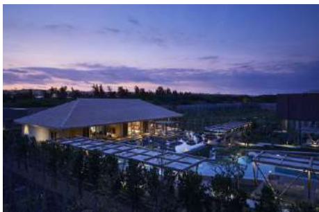
泳池旁的集館備有可自由使用的 Lounge

水溫最高可加熱到 40 度，一整年都可以在泳池中感受沖繩隨著季節與時間而變化萬千的天空與海景。