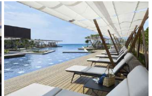
通風的泳池休息區