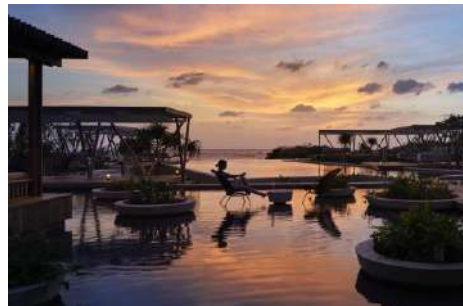
夕陽照射下的淺灘區