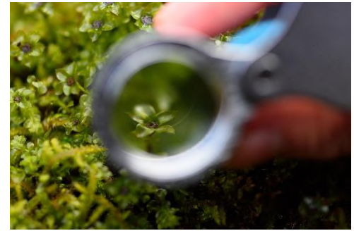
透過放大鏡觀察綠走邊燈蘚

這個苔蘚觀察組包含觀察苔蘚的放大鏡、給苔蘚澆水的噴霧器、寫有苔蘚種類及特徵的苔蘚隨身圖鑑等，希望客人能利用這一觀察組盡情欣賞苔蘚。