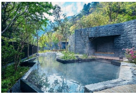
独创性设计的露天温泉