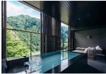
“月见”的半露天温泉